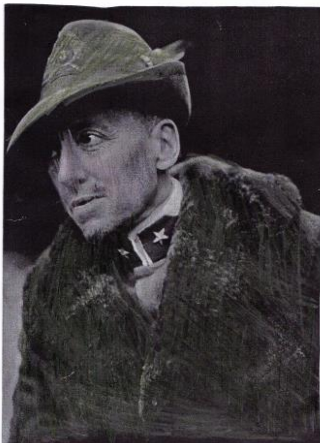
D'ANNUNZIO NELLA DIVISA DI LEGIONARIO A FURME NEL 1900

GABRIELLE D'ANNUNZIO ILI PRAVOG IMENA GAETANO RAPAGNETA STIGAO JE U RIJEKU I TO BIJAŠE VELIKA ŠTETA.